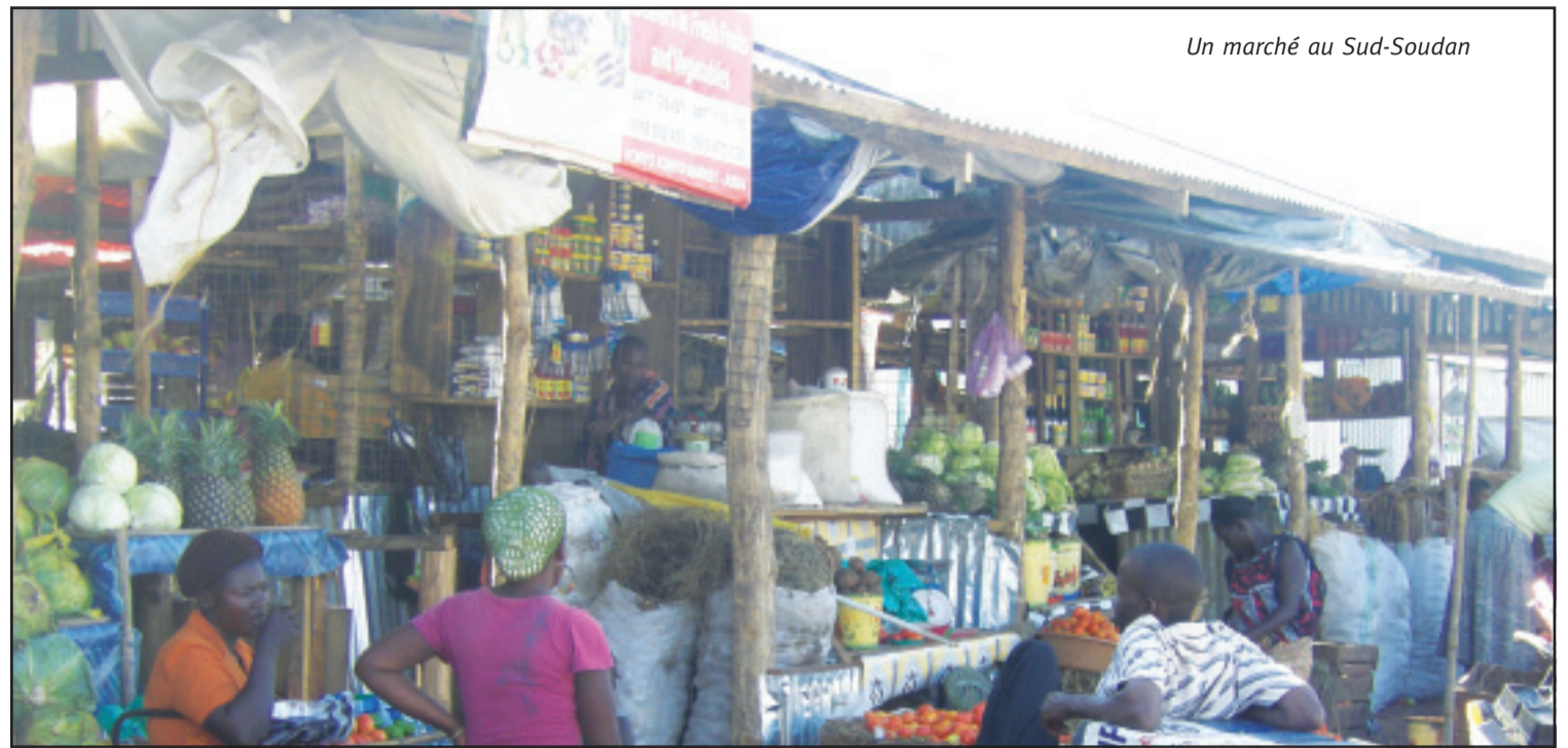
Un marché au Sud-Soudan

Actuellement 98% du budget public du Sud-Soudan est basé sur les ressources pétrolières, ce qui pose un risque grave pour le gouvernement, non seulement en termes d'efforts de construction de l'État mais également parce que les recettes pé-